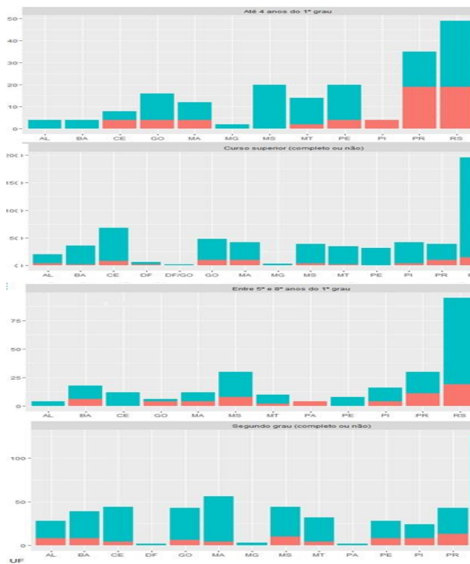
Figura 2: Nível de interesse, escolaridade e o tamanho da propriedade em ha 2 . UFSJ, Sete Lagoas-MG, 2016.