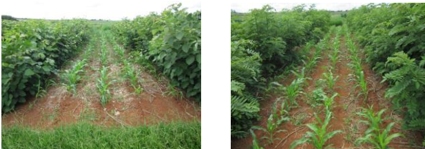
Figura 1. Em 06/01/2016, 50 dias após a semeadura do milho, persistem restos da poda ocorrida em 29/10/2015. Esquerda CA, direita GS.

espaçadas por 4 m, com uma planta a cada 0,5 m, (duas fileiras laterais e uma central), com 20 m de comprimento (mudas de CA e estacas de GS), tendo cada sistema uma área de 160 m 2 . Após as podas de condução iniciais (agosto e outubro de 2013, conforme GOMES et al., 2015), as leguminosas receberam podas drásticas a partir de novembro de 2013, sem qualquer medida de proteção para as plantas (pasta bordalesa ou cúprica), o que permitiu avaliar a rusticidade das leguminosas e a economicidade do arranjo produtivo. A cada 3 meses, pelas podas drásticas manuais, obtém-se o peso da fitomassa verde (soma do peso de folhas e galhos), então depositada sobre as faixas de cultivo comercial, por 27 meses. Os macro e micronutrientes aportados às áreas foram calculados a partir das fitomassa seca das folhas (65 °C, por 48 horas) pelo método de análise ICP-OES. O acréscimo de nutrientes foi subestimado, pois não foi contabilizado o peso dos galhos, que fornecem nutrientes mais lentamente que as folhas. Nas 4 faixas de cultivo (80 m 2 cada), procedeu-se a semeadura mecanizada direta do milho (0,70 m entre fileiras, quatro sementes/m, 30.000 pl.ha -1 ), em 15/12/2015 (23º mês após o início das podas drásticas), sobre palhada das leguminosas (5.000 pl.ha -1 ). Foram semeadas cinco fileiras de milho e avaliadas as três fileiras centrais, conforme Figura 1 .