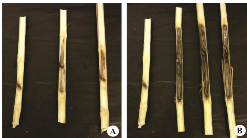
Figura 1. Teste de patogenicidade. A: Método do palito imerso em suspensão de esporos de Phaeocystostroma ambiguum ; B: Método